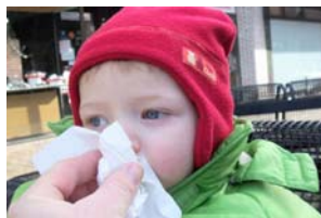
Laufende Nasen gibt es derzeit bei Jung und Alt.

A und O der Vorbeugung ist ein starkes Immunsystem, denn ihm haben wir es zu verdanken, dass wir nicht ständig erkältet sind. Viren lauern überall. Daher gilt es, das Immunsystem zu stärken. Unterstützen kann man dies durch die Ernährung. Dazu sollte man in erster Linie auf eine vitamin- und mineralstoffreiche Kost mit viel Obst und Gemüse, auch