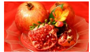
Gesundheit pur mit Granatäpfeln.

Dem Granatapfel werden wunderbare Wirkungen nachgesagt. So soll er Prostata- und Brustkrebs bremsen, Herz-Kreislauf-Beschwerden lindern, den Blutdruck senken und sogar anti-entzündlich wirken. Es gibt sogar wissenschaftliche Studien, die diese Heilwirkungen bestätigen. Zum Granatapfel sind in den letzten Jahren über 150 positive wissenschaftliche Studien in anerkannten Fachzeitschriften veröffentlicht worden.