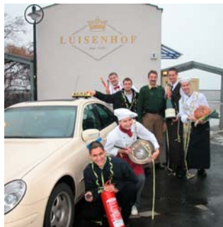
Gastronomen, Taxifahrer, Feuerwehrleute oder Polizisten mussten in der Neujahrsnacht arbeiten und durften im Dresdner "Luisenhof" nachfeiern.