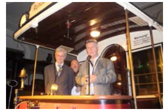
In einer Dresdner Straßenbahn von 1895 meinten die Vorstände der DVB AG: "Zukunft braucht Vergangenheit!"

Ein Glück gibt es bei uns noch die Straßenbahn", sagen heute Verkehrsexperten in deutschen Städten, die diese innerstädtischen Schienenfahrzeuge nicht ausrangiert haben. International bekommt die "Elektrische" derzeit einen riesigen Aufschwung. In Dresden konnte die Verkehrsbetriebe AG im letzten Jahr 144 Millionen Fahrgäste befördern, rund zwei Millionen mehr als im Vorjahr. Auch die Touristen sind froh, dass es gute