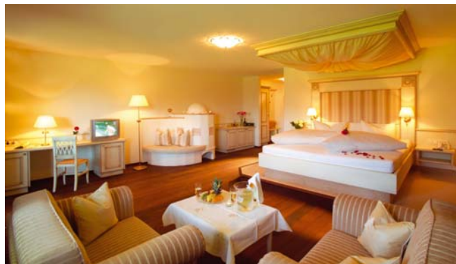
In der Suite "Alpina" lässt sich das Leben genießen.

Den Lesern der "gast&rast" sollen wir noch dieses exklusive "2