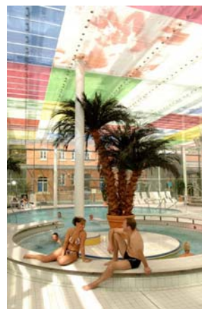
Das „Elsterado“ wird „10“.

Am Sonntag wird von 10 bis 18 Uhr dieses Jubiläum gefeiert, u.a. mit kostenlosen Aquasportkursen. Der Eintritt in den Badebereich ist frei.