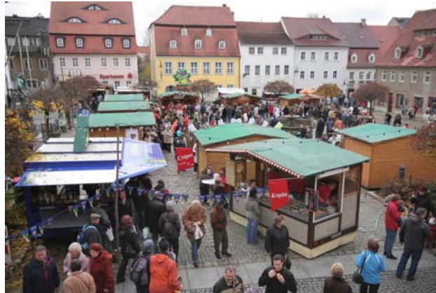
110.000 Besucher wurden vergangens Jahr beim Pfefferkuchenmarkt in Pulsnitz gezählt.

makronen auch mit Schokolade, auf Oblaten gebackene - da kann einem schon bei der Aufzählung das Wasser im Munde zusammen laufen.