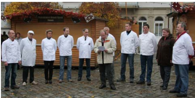
Die acht Handwerksmeister und eine Meisterin zur Eröffnung des Pfefferkuchenmarktes 2008.

Mit Zuckerglasur überzogene Pfefferkuchen, gefüllte und ungefüllte Schokoladen, Vollkornpfefferkuchen, mit Mandeln oder Nüssen belegte Pfefferkuchen, feine Kokos-