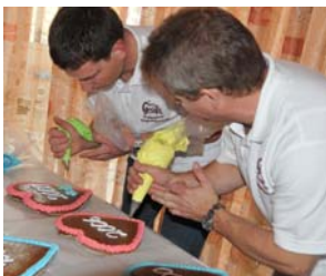
Das Verzieren der Pfefferkuchenherzen ist eine Kunst für sich.

Jede der acht Kuchlereien in der Handwerkerinnung und die Lebkuchenfabrik bäckt mit geheimen und selbstentwickelten Rezepturen, so dass es zwar bei einer ähnlichen Fertigungspalette bei jedem Betrieb anders gut schmeckt.