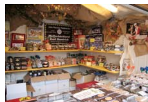
An jeder Bude gibt es eine bunte Vielfalt zum Mitnehmen.