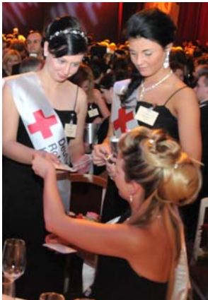
Eine Lotterie zu Gunsten der Erbebenopfer in Haiti.