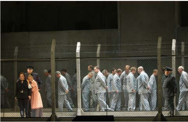
Der Gefangenenor in Beethovens Oper „Fidelio“.

Die Semperoper wird 25, und dieses Ereignis möchte die Sächsische Staatsoper gemeinsam mit ihrem Publikum feiern. Sie lädt die Zuschauer ein, ausgewählte Vorstellungen des Festtagsprogramms, zu einem Sonderticketpreis von 25 Euro zu besuchen.