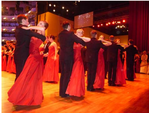
Alles Walzer mit 90 Debütantenpaaren.