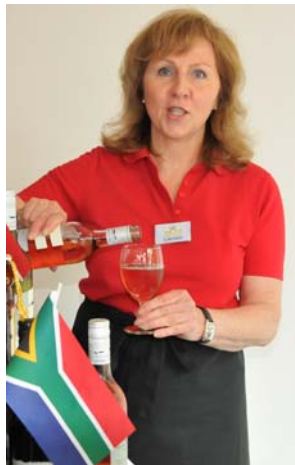
Den frischen Wein gibt es bei der Karstadt-Feinkost