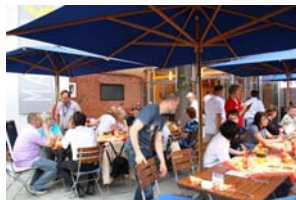
Auf der Terrasse des Nudelcenters Riesa.

Temperaturen bis 37 °C haben den Riesaern in den vergangenen Tagen einen heißen Sommer beschert. Die Wärme soll laut Wetterbericht noch einige Tage anhalten. An solchen ungewöhnlich warmen Sommertagen sucht man gern ein schattiges Plätzchen zum Entspannen. Erholung ist garantiert auf der gemütlichen Sommerterrasse im Nudelcenter der Teigwaren Riesa. Bei Temperaturen um die 30 °C sind hausgemachte Eiscreme (Schoko, Vanille, Stracciatella, Banane-Chili, Pfirsich, Karamell-Mandel) oder eine frische Fassbrause