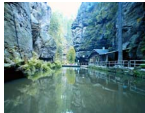
Ideal bei der Sommerhitze: Die Schluchten der Sächsischen Schweiz.

Während ganz Deutschland schwitzt, lädt die Sächsischen Schweiz zum erfrischenden Flanieren ein. Das besondere Mikroklima in den Gründen, Schluchten und Tälern des Gebirges macht es möglich. Die Gastgeber der Region haben bereits passende Pakete geschnürt. Für Kurzentschlossene halten die Gastgeber der Region fertige Komplettpakete für jeden Geschmack und Geldbeutel parat. Ausführliche Informationen dazu sind auf der Internetseite des Tourismusverbandes zu finden. www.saechsische-schweiz.de