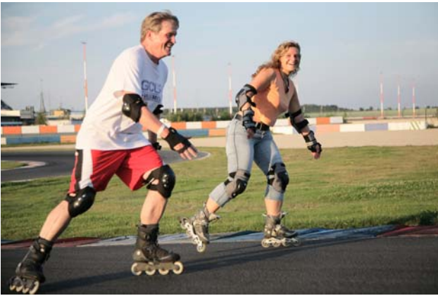
Skater sind am Donnerstag zum Saisonfinale auf dem Lausitzring eingeladen.

Am morgigen Donnerstag lädt der Lausitzring alle Skate- und Radfans zum Saisonfinale 2010 der „Lausitzer Bladenight“ ein. Von 18 bis 21 Uhr wird der schnellste Asphalt der Lausitz an diesem Tag geöffnet sein. Allen, die auf Inlinern unterwegs sind, steht der 4,3 km lange Grand Prix-Kurs zur Verfügung. Für Radfahrer wird der Zwei-Meilen-Superspeedway rund um das Trioval geöffnet. Traditionell wird die letzte Veranstaltung der Saison wieder mit einer großen Verlosung enden. Neben dem Hauptpreis, einem Paar Inline-Skates im Wert von 150 Euro, stehen noch weitere Preise im Wert von ca. 500 Euro bereit.