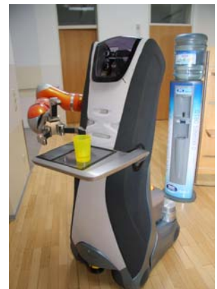
Robbie ist zu Diensten.

Schwere Kisten transportieren, Getränke anbieten und die geleistete Arbeit zuverlässig dokumentieren – Serviceroboter, die in stationären Pflegeeinrichtungen Transportaufgaben und Routinetätigkeiten übernehmen, können das Personal signifikant entlasten. Ein erster Praxistest mobiler Serviceroboter im Altenheim zeigt, dass sowohl Pflegekräfte als auch Bewohner die Unterstützung durch Roboter akzeptieren.