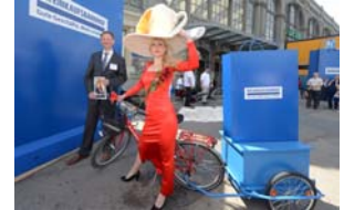
So wird jetzt für den Einkaufsbahnhof Dresden-Hauptbahnhof geworben.

Anmeldung: www.parkeisenbahn-dresden.de/fuehrung