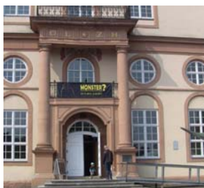
Hier gingen die Gebrüder Grimm in Kassel zu Schule.

Der Schwerpunkt von „GRIMM 2013“ liegt in Kassel. Darüber hinaus gibt es in ganz Hessen und entlang der Märchenstraße zahlreiche Spielorte und Veranstaltungen. Gründe genug, Sie zu einer Reise einzuladen. Wir wählen als Quartier das Maritim Badhotel Bad Wildungen, von wo aus man die Grimm-Stationen gut erreichen kann.