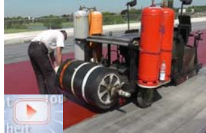
Auf der Waldschlösschenbrücke wird jetzt die Asphaltdecke der Fahrbahn aufgetragen.