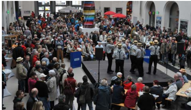
Ein beliebter Spielort war auch der Hauptbahnhof. 69 Stunden gab es Dixieland kostenfrei.

Das 43. Internationale Dixieland-Festivals, Europas größtes Musikfest für Oltime-Jazz ist seit Sonntag Geschichte. Zwei ausverkaufte Konzerte und ein begeistertes Publikum haben den Beweis erbracht: Der Alte Schlachthof ist als neue Hauptspielstätte von den Dixielandfreunden angenommen worden und hat die Wehmut nach der vorherigen Spielstätte Kulturpalast