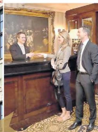
Bester Service im Hotel Suites