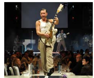
Die Firebirds rocken los bei der Mafia Mia-Show im Ostrapark.