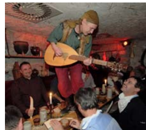
Im Zarenkeller tanzen die Mittelalter-Gesellen auf den Tischen.

Weitere Informationen und Tickets: www.feiern-in-dresden.de