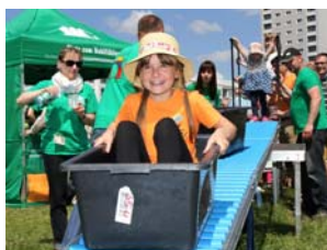
Ob beim Kistenrutschen odert beim Hausbau, auf der Cockerwiese geht es am 31. Mai wieder rund.