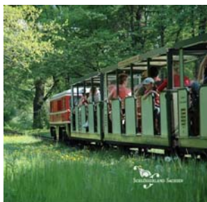
Die Parkeisenbahn fährt seit Ostern wieder durch den Großen Garten.