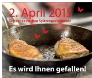
Es hat den Gästen gefallen.

Was in einem erstklassigen Restaurant angeblich als „unangenehm“ verpönt ist und gerichtlich von Sterneköchen quer durch die Republik schon mit Hausverboten geahndet wurde, war an diesem 2. April ausdrücklich erlaubt – die Teller am Tisch untereinander zu tauschen und vom Menü des Gegenübers zu