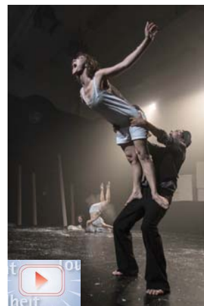
Wenn Sie auf das Foto klicken, sehen Sie ein Video mit O-Tönen.