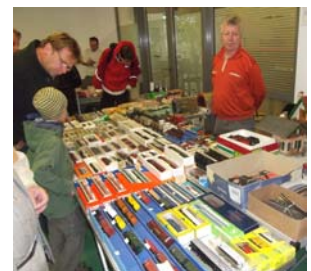
Wenn der Vater mit dem Sohn neues Material für die Modelleisenbahn sucht, kann er am Samstag fündig werden.

Außerdem helfen die Experten den Neulingen mit Tipps zu Ersatzteilen sowie Reparaturen und schätzen den Wert von Anlagen und Einzelstücken. Sei es nun, dass jemand einfach nur neugierig