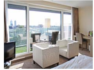
Ein Zimmer im THOMAS Hotel Spa & Lifestyle Husum.