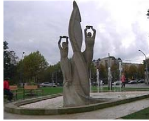
Der Springbrunnen „Der Flugwille des Menschen“ an der Güntzstraße.

Mit seinen etwa 300 Brunnen und Wasserspielen gehört Dresden zu den brunnenreichsten Städten Deutschlands. Derzeit werden 73 Brunnen vom Grünflächenamt der Landeshauptstadt betreut. Wartung und Instandhaltung kos-