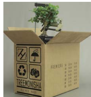
Premiere am 25. April, 19:30 Uhr, im Kleinen Haus.

„Treemonisha“ war 1972, 60 Jahre nach ihrer Entstehung, in Atlanta uraufgeführt worden. Im Originallibretto ist Treemonisha eine junge Afro-Amerikanerin in den von Sklaverei geprägten Südstaaten. Sie setzt dem Aberglauben der „black community“ die Kraft der Bildung entgegen. In der Dresdner Choreografie und Regiearbeit von Massimo Gerardi wächst Treemonisha in der sozi-