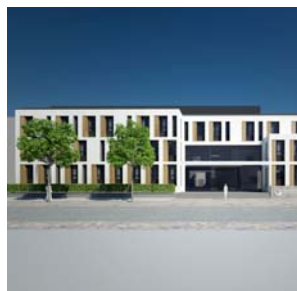
Ab Ende März 2016 sollen in diesem neuen Gebäude des Universitätsklinikums Krebspatienten behandelt werden.

In dieser Fahrsaison finden gleich zwei Jubiläen statt: Die Parkeisenbahn hat 65. Geburtstag und die beiden Dampflokomotiven werden stolze 90 Jahre alt. Beide Jubiläen werden zünftig gefeiert.