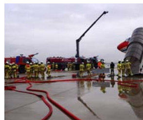
Regelmäßig wird am Flughafen Dresden der Notfall ge- probt.

Diese schwarz-roten Fässer gehen eigentlich in die ganze Welt, gefüllt mit Drahtseilsmierstoffen oder Korrosionsschutzmitteln von Elaskon aus Dresden. Jetzt verbindet das Unternehmen ein besonderes Engagement mit Südafrika. Es stattet die Trommler der „Blechlawine“ für ihre Performance bei der HOPE-Gala mit neuen Metallfässern aus. Die Benefiz-Gala findet am 31. Oktober zum 10. Mal statt und sammelt Geld zugunsten des HIV-Projektes HOPE Cape Town in Südafrika. Wie im Vorjahr ist die „Blechlawine“ dabei und liefert vor dem Schauspielhaus ab 18 Uhr einen unüberhörbaren Auftakt. Seit ihrer Gründung vor 15 Jahren nutzt die „Blechlawine“ die auffälligen 200-Liter-Fässer von Elaskon. Für ihren Auftritt bei der HOPE-Gala haben die Trommler Nachschub an Instrumenten geordert, denn der Verschleiß beträgt 15 Fässer pro Jahr.