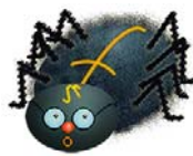
Die Spinne MINT ist das Makottchen.

Das seit 2002 bestehende Projekt öffnet jetzt für alle Dresdner Kita- und Grundschulkindern seine Pforten. Angeboten werden MINT-Kurse in unterschiedlichen Stufen und ein 'Kinder führen Kinder' - Kurs, welche bisher nur Kindern einzelnen Schulen offen standen.