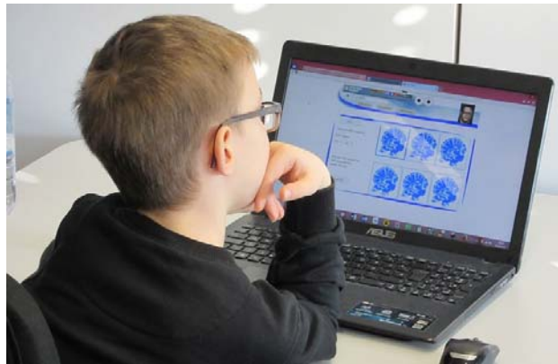
Als Lesehilfe wird der Computer eingesetzt.

„Mr. Dresden“®: Wie würden Sie das Wort Legasthenie definieren?