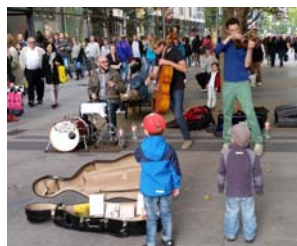
Die Gruppe Stilbruch, hier beim Konzert auf der Prager Straße, feiert morgen im Alten Schlachthof ihr zehnjähriges Jubiläum.

In diesen regelmäßigen Arbeitsgemeinschaften lernen die Kinder strukturiert, vielseitig und tiefgründig wissenschaftliche Grundbegriffe kennen und bekommen ihre