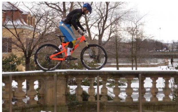
Der sechsfache Weltmeister im Trial-Bikesport, Marco Hösel, hier auf der Mauer der Dresdner Bellevue-Terrasse, wird auch in Berlin seine Kunst zeigen.

Auf der Bühne begeistern die Tänzer mit spektakulären Tricks und atemberaubender Akrobatik. Hingucker“ dürfte ein riesiger