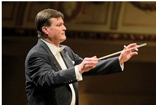
Christian Thielemanns Vertrag als Chef der Staatskapelle läuft bis 2019. Man spricht über eine Verlängerung.