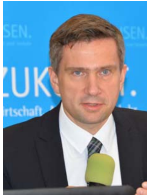
Wirtschaftsminister Martin Dulig will kleine und mittelständische Unternehmen beim Export unterstützen.

43 Prozent der Ausfuhren der neuen Flächenländer kamen 2015 aus Sachsen. Wichtigste Ausfuhrländer waren erneut China (Platz 1: 14,6 Prozent), die USA (Platz 2: 12,1 Prozent) und das Vereinigte Königreich (Platz 3: 5,7 Prozent). 45 Prozent der Ausfuhren gingen 2015 in die Mitgliedstaaten der Europäischen Union, im Jahr davor waren es 43,2 Prozent. Unter den wichtigsten Handelspartnern stiegen die Ausfuhren besonders stark in die USA (+37,5 Prozent), nach Spanien (+25,6 Prozent), in die Schweiz (+24,2 Prozent), nach Italien (+22,1 Prozent) und Schweden (+21,8 Prozent). Rückläufig waren hingegen die Ausfuhren nach China (-13,1 Prozent) und in die Republik Korea (-15,2 Prozent). Ursache dafür ist das nachlassende Wirtschaftswachstum in diesen Ländern. Insgesamt konnten diese Rückgänge aber durch den Anstieg der Ausfuhren in andere Länder gut kompensiert werden. Die Ausfuhren in die Russische Föderation nahmen 2015 erwartungsgemäß weiter ab (-14,8 Prozent). Hauptgrund dafür sind die in Russland zurückgehenden Investitionen aufgrund des niedrigen