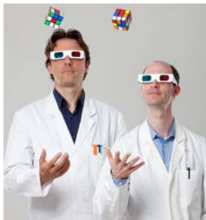
Aus der international Aufsehen erregenden Show „Metamagucun“.