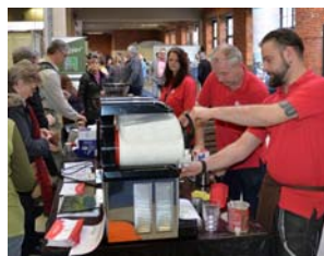
Am Stand von KAFFANERO war der Kaffeedurst der Besucher groß.