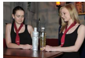
Der neue Premium-Wodka ist auch was für die Damen.

Ein Dresdner hatte im November 2010 gegen die Radwege auf der Kesselsdorfer Straße geklagt. Sie seien zu schmal, haben einen zu geringen Sicherheitsabstand zu parkenden Autos und entsprechen überhaupt nicht den heutigen Normen. Die Klage vor dem Verwaltungsgericht Dresden hatte Erfolg, und die Stadt wurde beauftragt, Abhilfe zu schaffen. Die wird jetzt kurzfristig durchgesetzt. Die Radweg-Zeichen werden ab 20. Juni kassiert, womit die etwa 1.500 Radfahrer täglich auf die Straße müssen. Parkende Autos sind dann aber eine gefährliche Behinderung, so dass auch die bisher 120 Parkflächen gestrichen werden. Dass die Gewerbetreibenden mit dieser Lösung nicht glücklich sind, versteht sich. Sie befürchten Umsatzeinbußen.