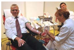
Finanzbürgermeister Hartmut Vorjohann bei der Blutspende.

Sobald die Ferien beginnen und die Temperaturen steigen, kommen weniger Blutspender zum Deutschen Roten Kreuz (DRK). Im Bundesschnitt sind laut DRK überhaupt nur zwei bis drei Prozent der Bevölkerung regelmäßige Spender. 15.000 Blutkonserven werden aber in Deutschland täglich benötigt.