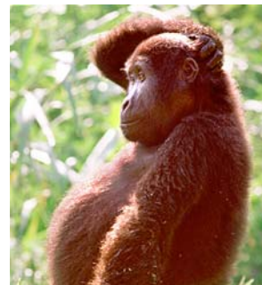
...dass sich Stadt und Gagfah mit schweren Waffen bekämpfen.

Auf die Milliardenklage der Stadt gegen den Immobilienkonzern Gagfah kam jetzt die Antwort. Gagfah verklagt Dresden über 880 Millionen Euro wegen erlittenem Imageschaden. Die Aktie ist rapide in den Keller gesunken. Ich sehe jetzt ein langwieriges Gerichtsspiel, bei dem nur die Anwälte gewinnen. Ich glaube nämlich, egal welche Seite hier Recht bekommt, Verlierer sind in jedem Fall die Mieter. Eine außergerichtliche Einigung wäre wohl doch besser gewesen.