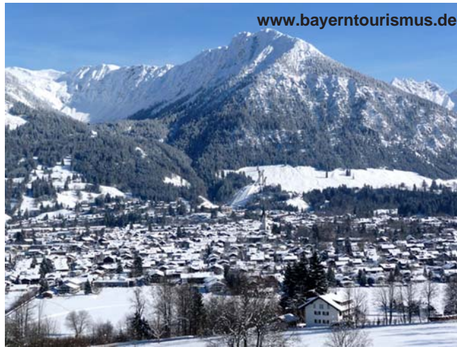
Wintersportparadies Oberstdorf.

Dabei ist die Frage nach dem Lieblingsberg für die Gäste des Oberstdorf Resort schnell beantwortet. Denn mit den täglichen gratis Bergbahnkarten und Skipässen für alle sechs Bergbahnen im Oberstdorfer Gebiet und dem Kleinwalsertal können sie alle Pisten von Deutschlands größtem Skigebiet erkunden. VIP-Ski-Shuttle inklusive.