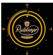
Die Radeberger Uhr zählt die letzten Minuten.

Dresden wird am letzten Tag des Jahres zur exklusiven Silvesterstadt. Eine unvergessliche Nacht kann man inmitten der atemberaubenden Silhouette zwischen Semperoper, Zwinger, Kathedrale und dem Dresdner Schloss erleben.